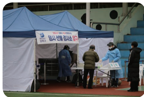
* 사진: 강북구보건소 임시선별진료소에서 코로나19 검체를 채취하는 정아지 회원의 모습