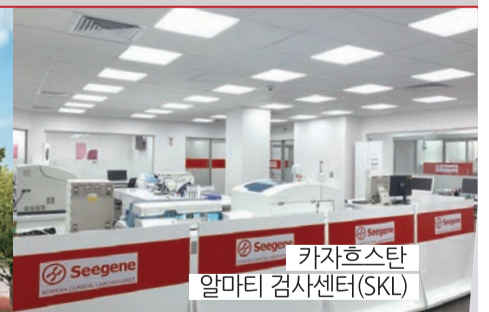
카자흐스탄 알마티 검사센터(SKI)

씨젠의료재단 본원 | 서울특별시 성동구 천호대로 320 부산경남검사센터 | 부산광역시 동구 중앙대로 297 대구경북검사센터 | 대구광역시 수성구 달구벌대로 2619 광주호남검사센터 | 광주광역시 남구 효우로 200 카자흐스탄 알마티 검사센터(SKI) | Almaty, Kazakhstan