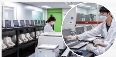
❖ ONE DAY 신속한 결과보고