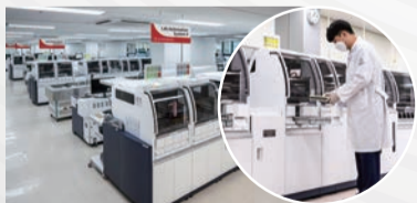
❖ 검사실 자동화(TLA) 시스템 구축

질병검사 전문의료기관 (재)씨젠의료재단 은 검사 품질의 완벽 을 추구합니다