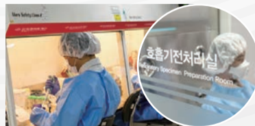
❖ K-방역 최일선