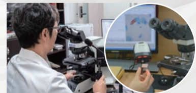
❖ AI(인공지능) 등 최신퉴크 도입

씨젠의료재단본원 | 서울특별시 성동구 천호대로 320 부산경남검사센터 | 부산광역시 동구 중앙대로 297 대구경북검사센터 | 대구광역시 수성구 달구벌대로 2619 광주호남검사센터 | 광주광역시 남구 효우로 200 카자흐스탄 알마티 검사센터(SKL) | Almaty, Kazakhstan