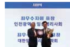
최우수분과학회 표창 (대한임상생리검사학회)